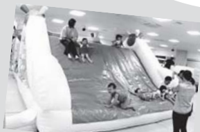
フワフワ滑り台にすべったり、よじ登ったり♪