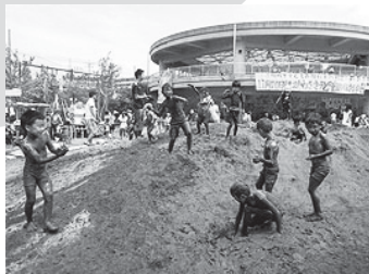
みんなで全身泥んこ!

おすすめは泥んこ遊びです! これからの季節は水を使った遊びがたくさんできるので、ご家族みんなで一緒に泥んこになって遊んでみてください。アスレチックやトンネルもあるので、身体をいっぱい使って遊ぶことができます。また、屋根付き広場もあるので、天気を気にせず遊ぶことができます。