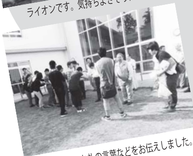
運転手さんへお礼の言葉などをお伝えしました。「ありがとうございました!!」