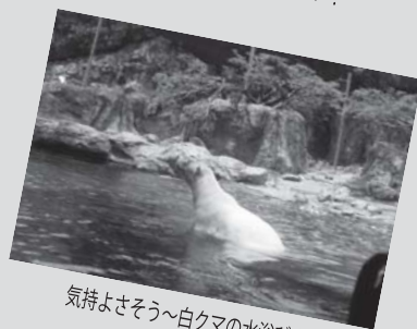
気持ちよさそう〜白クマの水浴び♪

センター北・南駅より徒歩5分ほどの場所にある、ルララ港北内の室内遊び場です!「アメイジングワールド」は遊びを通して、徳育(こころ)、体育(からだ)、知育(あたま)、をぐんぐん伸ばすことを目的としている子どもたちに大人気の遊び場です★