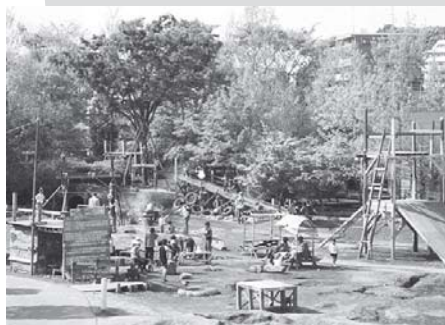
子ども夢パークの全景です！！