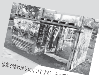
写真ではわかりにくいですが、とってもカラフル！

子どもたちは夢パークに着くと、好きな遊具に飛びついていました！写真にも載っていますが、広場の中央に泥んこスペースがあり、お母さんや職員と一緒に泥だらけになって遊んでいました。他にもブランコや三輪車など多くの遊具があり、思う存分楽しめていました！