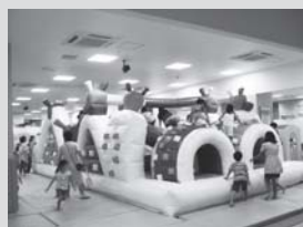
サボテンジャングル、てっぺんを目指せ!

年齢の高いお子さんはたくさん身体を使って遊べるのはもちろん、小さなお子さんは0~3歳コーナーがあり、小さな滑り台とボールプールや、好きなだけお絵かき出来る大きな壁も魅力の1つです! 大人も夢中になって遊べ、ご家族で1日中楽しむことができますよ!!