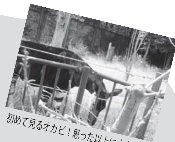
初めて見るオカピ!思った以上に大きい!