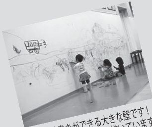
自由に落書きができる大きな壁です! 子どもたちは夢中で絵を描いています♪

靴と靴下を脱いで、まず目に入るのは空気が入った大きな滑り台! サボテンジャングルという遊具で、名前の通りサボテン等の障がい物をかき分けながら、みんなで必死によじ登ります。男の子たちにはプラズマカーも人気です! 足を使わず手を左右に動かすだけで動き、より自分で運転している気分を味わえる遊具です♪