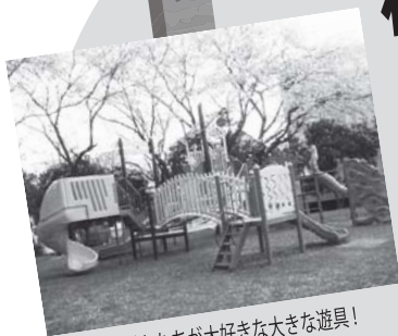
子どもたちが大好きな大きな遊具！

東急田園都市線鷺沼駅から徒歩10分ほど、宮前区にある有馬つつじ公園です。大きな滑り台やブランコ、ジャングルジムがあり、たくさん身体を使って遊べますよ！