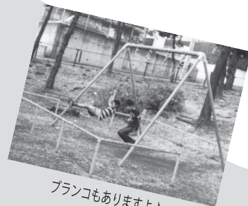
ブランコもありますよ♪

公園に着くとみんな、1番人気の大きな滑り台にまっしぐら！お母さんと一緒に大きな滑り台を滑ったり、広場を駆け回ったりと、それぞれが好きな遊びを楽しむ事ができました♪滑り台から少し離れた場所にブランコやジャングルジムもあるので、もっといっぱい身体を動かしたい子たちにも人気スポットでした！