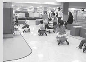
プラズマカーのコーナーです! 男の子たちは釘づけで大人気でした♪