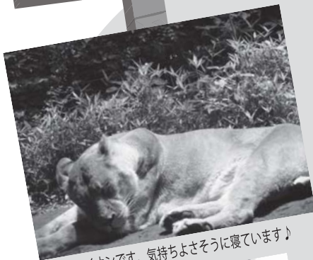
ライオンです。気持ちよさそうに寝ています♪

ライオンや、オカピのケージの前では、実物を目の当たりにして「オカピってこんなに大きいの!？」と驚く様子も見られました。動物観覧タイムの後には、お土産を買い、おこづかいの中で、「これが美味しそう!」「これもいい!」など、頭を悩ませながらも楽しそうに買い物をしていました。帰園後は、送迎してくれたタクシー運転手へ花束と感謝の言葉を贈り、最後は拍手で行事を終え、楽しい1日となりました。