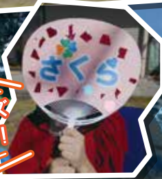
応援グッズ 作ったよ!