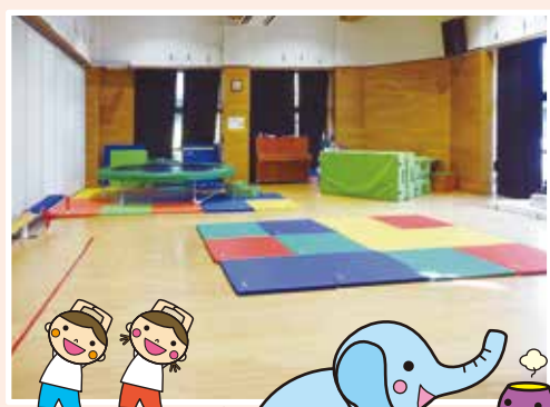
うんどう 運動ホール