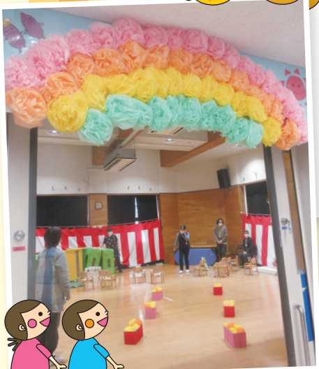
※写真は練習風景です