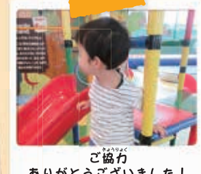
ご協力ありがとうございました！